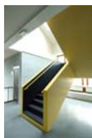
College de Meer Amsterdam Oktober 2011

Het onlangs geopende cancer center in VUmc is een ontwerp voor lichaam en geest waarbij rust en dynamiek voor zowel patiënt als personeel centraal staan. Geheel ontworpen volgens het door D/Dock ontwikkelde 'Brightsite' concept en gebaseerd op de 'healing environment' filosofie, biedt de poli een geruimtelijke en stressverlagende doch doelgerichte en actieve omgeving waar communicatie gestimuleerd wordt.