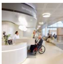
VUmc Cancer Center Amsterdam September 2011

Op 11-11-2011, de dag van de duurzaamheid, opende het eerste Cradle 2 Cradle kantoorpand in Nederland officieel haar deuren. Naast de kantoren van B/S/H biedt het pand in Hoofddorp ook onderdak aan het B/S/H Experience Center, met showrooms van de 5 merken, een kookschool, auditorium en koffiebar. Een groot deel van het interieur is geleverd onder de unieke Fornature voorwaarde.